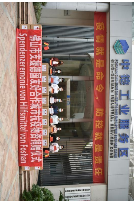
Die Stadt Foshan spendete 10 deutschen Mitgliederstädten in der chinesisch-deutschen Industriestadtallianz (ISA) insgesamt 100.000 Atemschutzmasken und 100 Thermometer.