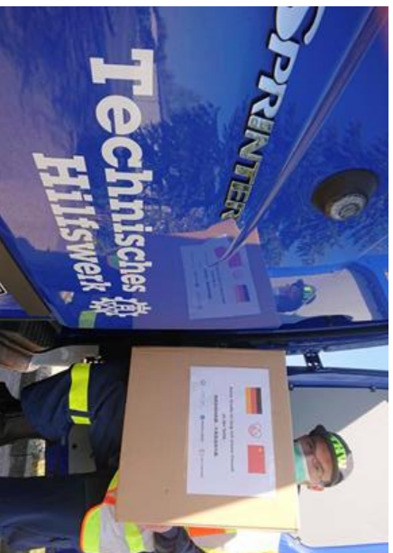
Die von der Stadt Aachen ernannten Bundeswehr übermittelten die gespendeten Materialien zügig an die dringend benötigten Abteilungen.