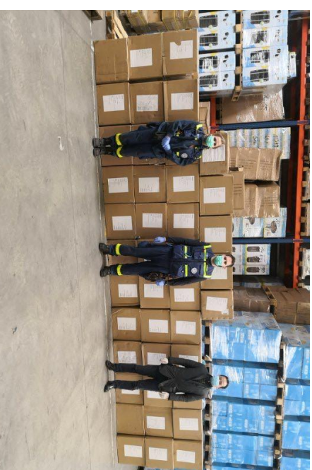
Die Stadt Aachen schickt Bundeswehr zum Zoll, um die Zollabfertigung zu begleiten und Waren abzuholen.